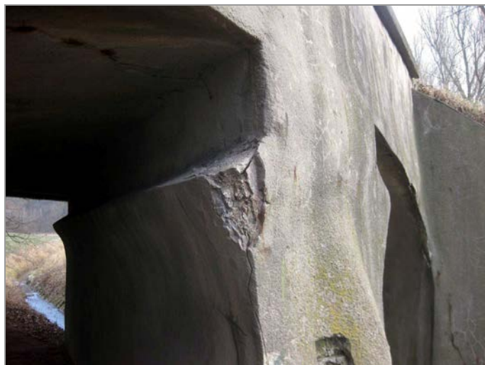
foto 1, 2: Pohled na původní (západní) část mostu - kamenné zdivo s betonovým nástřikem