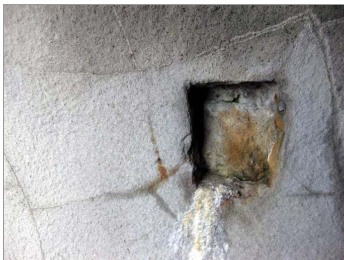
foto 3, 4: Detail původní (západní) část mostu - kamenné zdivo s betonovým nástřikem