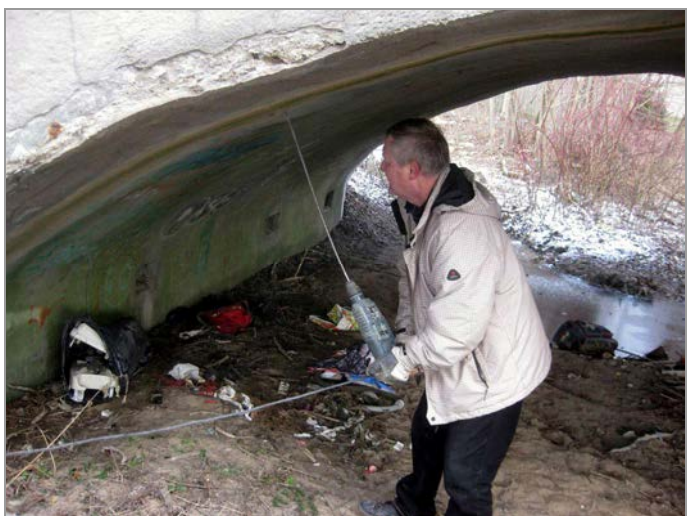
foto 11, 12: Ověřování tloušťky kamenného zdiva čela mostu a klenby