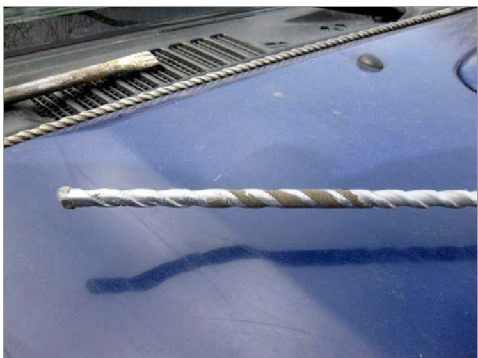
foto 23, 24: Ověřování skladky vozovky a jejího podloží v ploše mostu