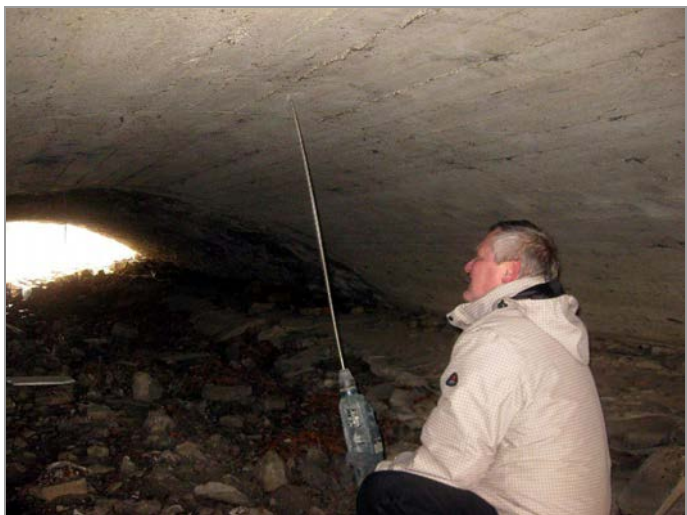
foto 21, 22: Pohled od jihu - ŽB klenba mostu a ověřování její tloušťky